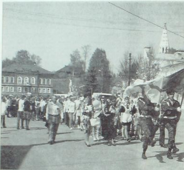
Праздничная колонна судиславцев шествует на митинг

Во всех поселениях района к празднованию 9 мая в этом году готовились с особым старанием. 65-летие Великой Победы – дата знаменательная, праздник нашей радости и боли. Радость – это Победа, одержанная советским народом в Великой Отечественной войне. И боль за всех, кто погиб в боях, пропал без вести, был замучен в плену, умер уже в мирное время от ран.